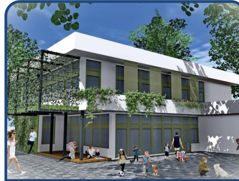
Széchenyi István Közösségi Ház