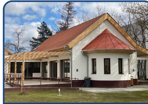
Hunyadvárosi Közösségi Ház