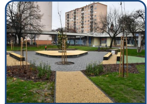
Közösségi tér rekonstrukció (Aranyasarvas tér)