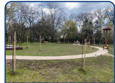
Hunyadvárosi Közösségi Ház udvar