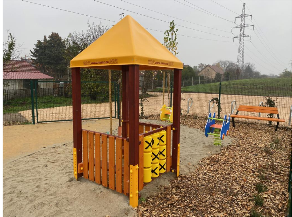
15 millió forint új játszótér építésére Kósafaluban